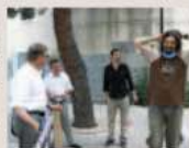
Les députés mettent la main à la pâte.