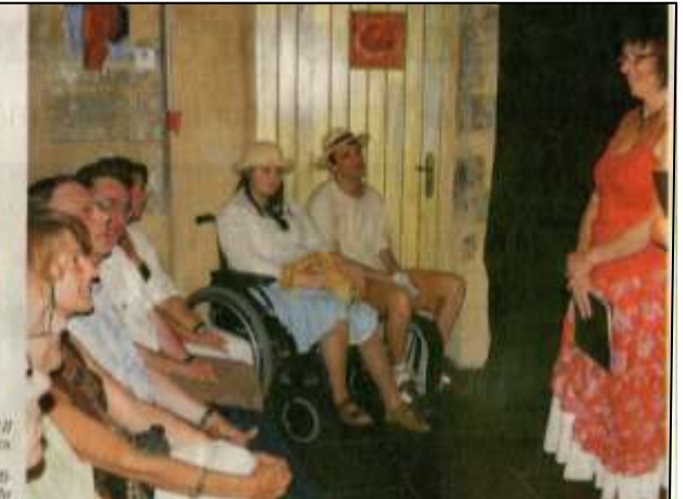
Les comédiens des Ferges ont goûté aux travaux du théâtre avignonnais. Qui y sera en juillet prochain ?