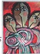
Alain THOLL de L'ENCLOS

Tous les jours du 20 au 25 juillet à 21h