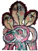
L'équipe de l'Art en Scène Théâtre

Il s'agit là d'une belle initiative de partage culturel et une invitation au voyage et à la découverte de ce qui se crée en dehors de nos frontières, nous lui tirons notre chapeau et lui souhaitons une très longue vie !