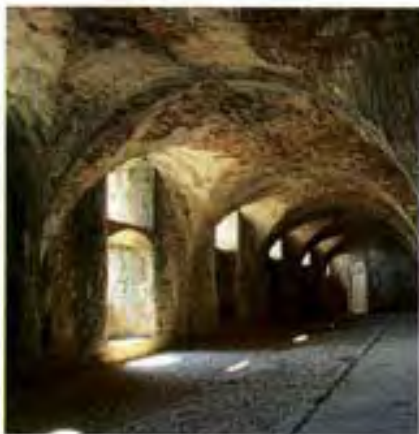
Le village se découvre à travers ses pierres, ses fleurs, sa nature luxuriante, son bois de Paiolive ou ses manifestations artistiques.